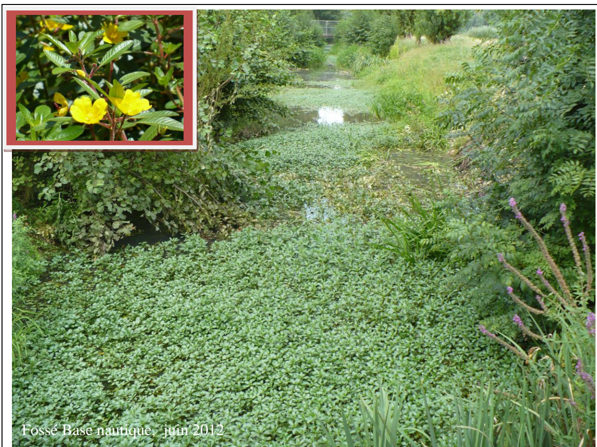
Fossé Base nautique, juin 2012

INSTITUTION INTERDEPARTEMENTALE DU BASSIN DE LA SEVRE NIORTAISE (IIBSN)