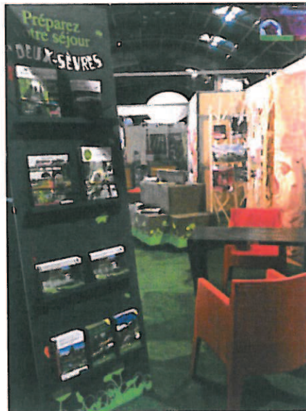
salon de Nantes

En liaison avec l'ADT 79, la structure a participé aux salons touristiques « grand public » de Rennes, Nantes et Lille qui accueillent chacun entre 30 et 50 000 visiteurs. Réalisées en mutualisant les moyens humains et financiers des 6 Offices de tourisme de Pôle et de l'ADT 79, ces opérations permettent à l'Office de Tourisme de suivre les attentes et besoins exprimés par nos visiteurs.